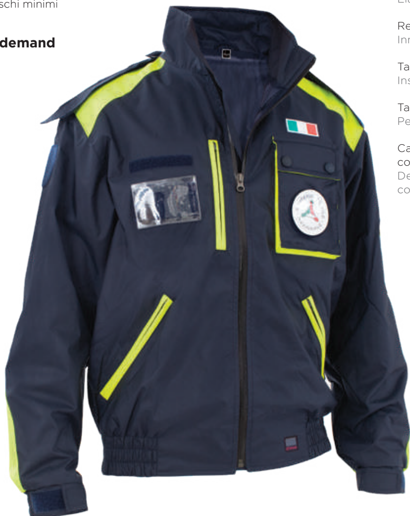
blu / blue 0700