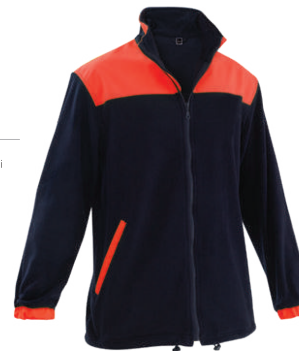
blu / blue 4007

CE DPI di 1° categoria per rischi minimi UNI EN ISO 13688:2022