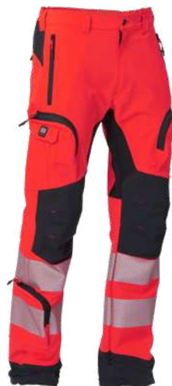
rosso / red 2708

Pantaloni alta visibilità. Tessuto bi-elastico idrorepellente e antibatterico High visibility trousers. Water-repellent, blood-repellent and antibacterial 4-way stretch fabric