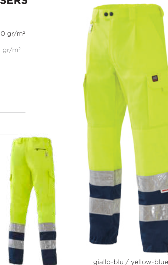
giallo-blu / yellow-blue 0700

Realizzato con tessuto conforme alla UNI EN ISO 4920:2013 (Resistenza alla bagnatura superficiale, idrorepellenza) con indice di bagnabilità ISO 5 - massima idrorepellenza. Made with fabric compliant to UNI EN ISO 4920:2013 (Determination of resistance to surface wetting) with performance indicator ISO 5 - maximum waterproof.