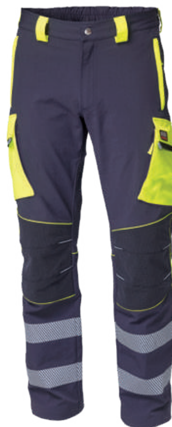
blu-giallo / blue-yellow 4086