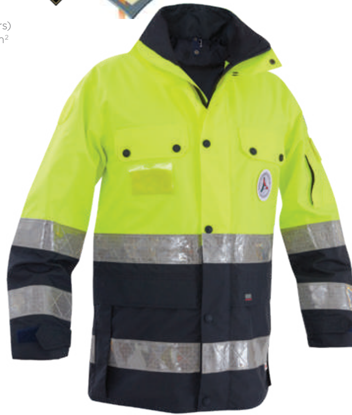
giallo-blu / yellow-blue 0700