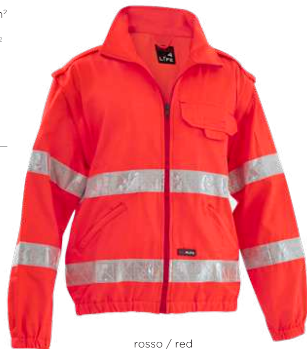
rosso / red 2006