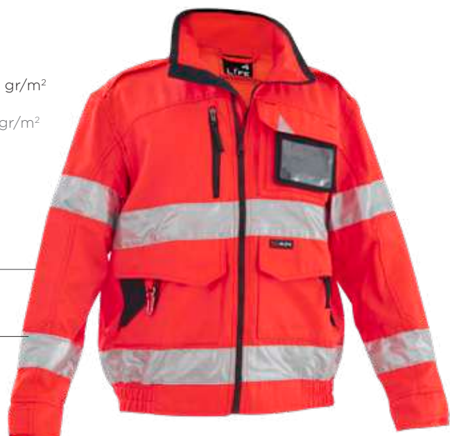
rosso / red 2006