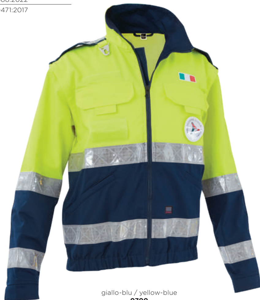
giallo-blu / yellow-blue 0700

Realizzato con tessuto conforme alla UNI EN ISO 4920:2013 (Resistenza alla bagnatura superficiale, idrorepellenza) con indice di bagnabilità ISO 5 - massima idrorepellenza. Made with fabric compliant to UNI EN ISO 4920:2013 (Determination of resistance to surface wetting) with performance indicator ISO 5 - maximum waterproof.