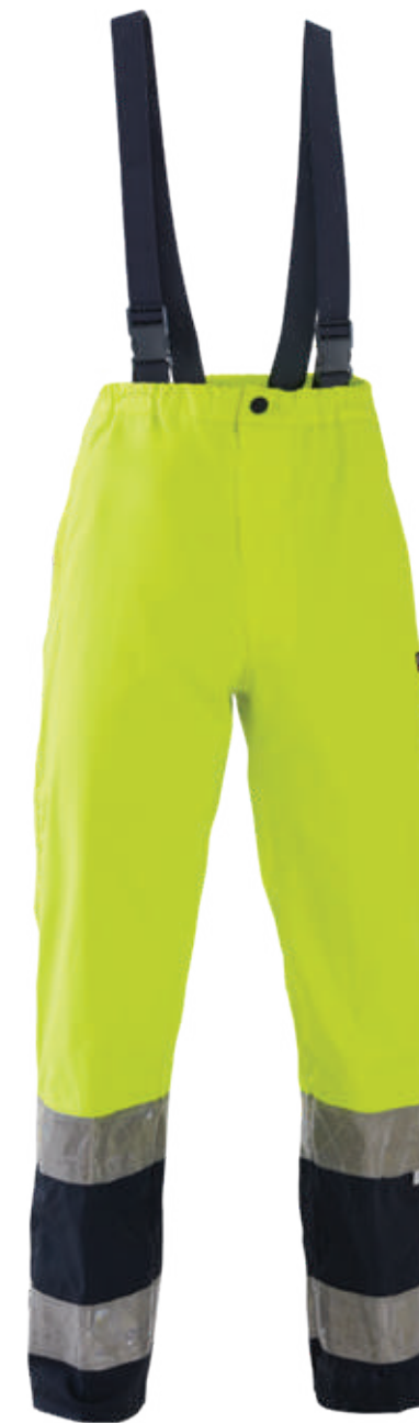
giallo-blu / yellow-blue 0700