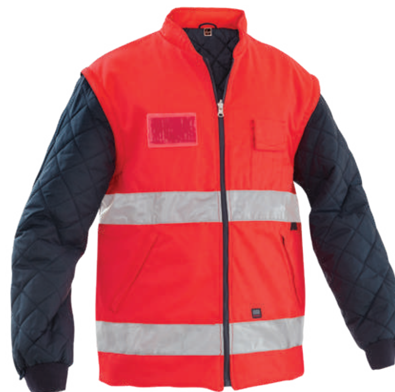
rosso / red 2006