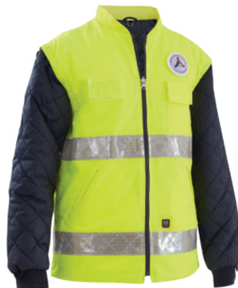
giallo-blu / yellow-blue 0700

Zip reversibile predisposta all'aggancio del giaccone Reverse zip for fastening the parka