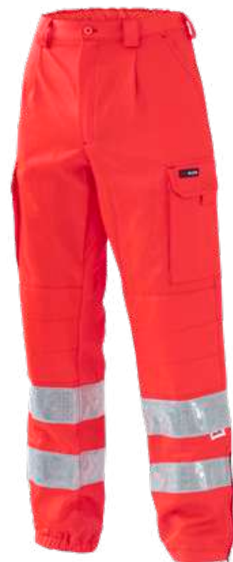
rosso / red 2006

Realizzato con tessuto conforme alla UNI EN ISO 4920:2013 (Resistenza alla bagnatura superficiale, idrorepellenza) con indice di bagnabilità ISO 5 - massima idrorepellenza. Made with fabric compliant to UNI EN ISO 4920:2013 (Determination of resistance to surface wetting) with performance indicator ISO 5 - maximum waterproof.