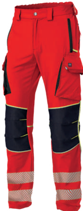
rosso / red 2708

Realizzati con tessuto conforme alla UNI EN ISO 4920:2013 (Resistenza alla bagnatura superficiale, idrorepellenza) con indice di bagnabilità ISO 5 - massima idrorepellenza. Made with fabric compliant to UNI EN ISO 4920:2013 (Determination of resistance to surface wetting) with performance indicator ISO 5 - maximum waterproof.