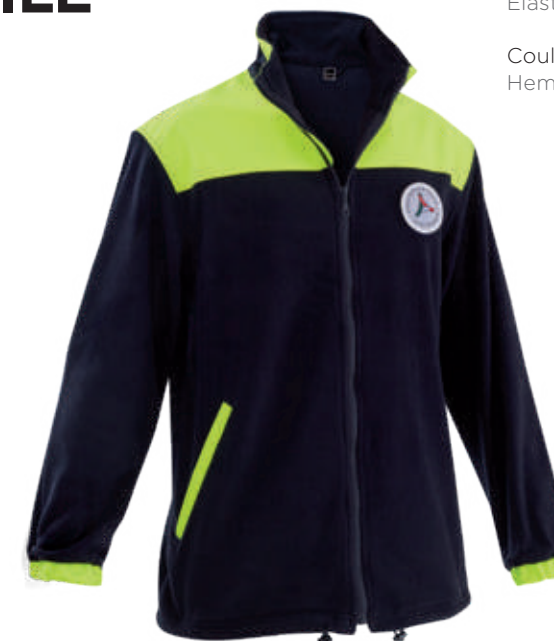
blu / blue 4701

DPI di 1° categoria per rischi minimi UNI EN ISO 13688:2022