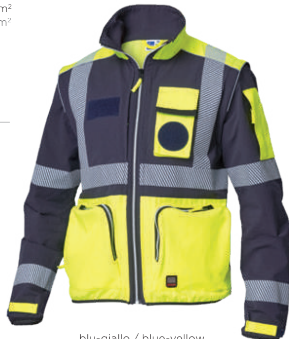
blu-giallo / blue-yellow 4086