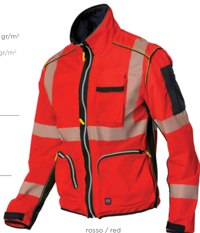
rosso / red 2708

Realizzati con tessuto conforme alla UNI EN ISO 4920:2013 (Resistenza alla bagnatura superficiale, idrorepellenza) con indice di bagnabilità ISO 5 - massima idrorepellenza. Made with fabric compliant to UNI EN ISO 4920:2013 (Determination of resistance to surface wetting) with performance indicator ISO 5 - maximum waterproof.