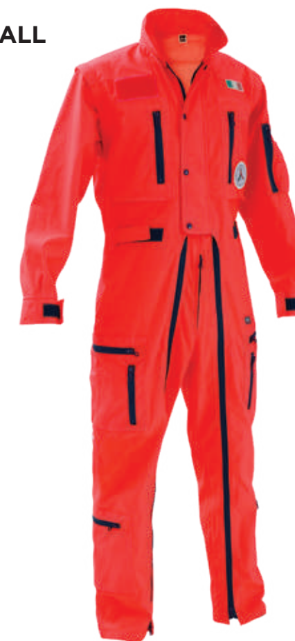
rosso / red 2006

Realizzato con tessuto conforme alla UNI EN ISO 4920:2013 (Resistenza alla bagnatura superficiale, idrorepellenza) con indice di bagnabilità ISO 5 - massima idrorepellenza. Made with fabric compliant to UNI EN ISO 4920:2013 (Determination of resistance to surface wetting) with performance indicator ISO 5 - maximum waterproof.