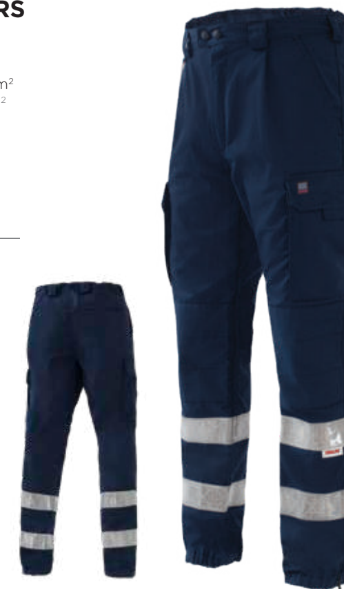
blu / blue 4007

DPI di 1° categoria per rischi minimi UNI EN ISO 13688:2022