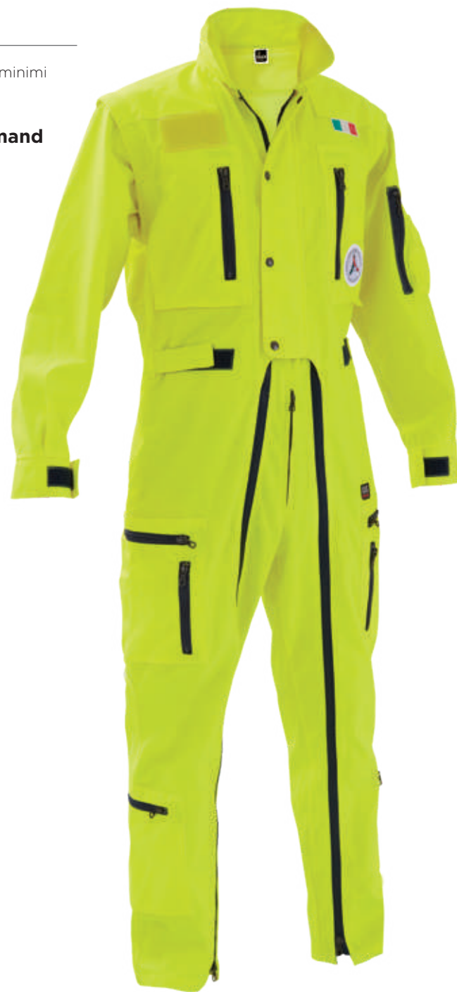
giallo / yellow 0019

Realizzato con tessuto conforme alla UNI EN ISO 4920:2013 (Resistenza alla bagnatura superficiale, idrorepellenza) con indice di bagnabilità ISO 5 - massima idrorepellenza. Made with fabric compliant to UNI EN ISO 4920:2013 (Determination of resistance to surface wetting) with performance indicator ISO 5 - maximum waterproof.