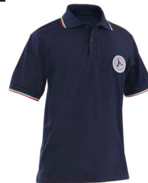
blu / blue 4034

DPI di 1° categoria per rischi minimi UNI EN ISO 13688:2022