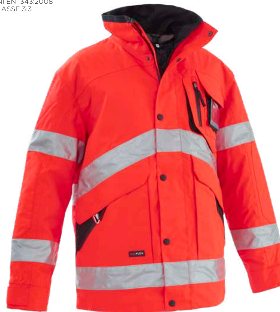
rosso / red 2006

Chiusura con zip e bot- toni a pressione Zip closure with snap buttons