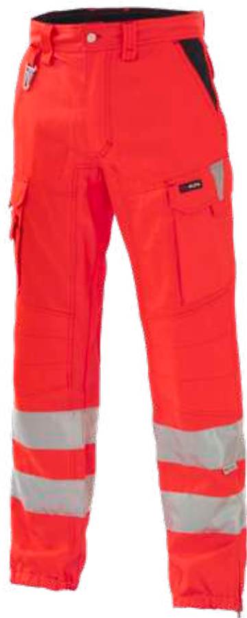
rosso / red 2006

CE DPI di 2° categoria UNI EN ISO 13688:2013