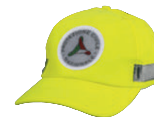
giallo / yellow 0019