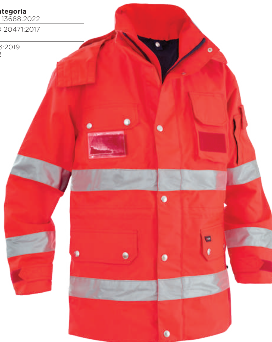
rosso / red 2006