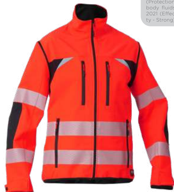
rosso / red 2708